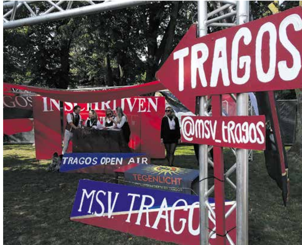
Stand van Tragos tijdens de INKOM van 2024, voornamelijk het laatste jaar dat de vereniging deelnam

Wat de oorzaak ook zij, de teruglopende ledenaantallen zorgen voor problemen. “Het wordt steeds lastiger om bestuursleden te vinden of commissies te vullen”, zegt Gielen. “Dat is overigens iets dat ook speelt bij andere verenigingen, in Maastricht en daar-