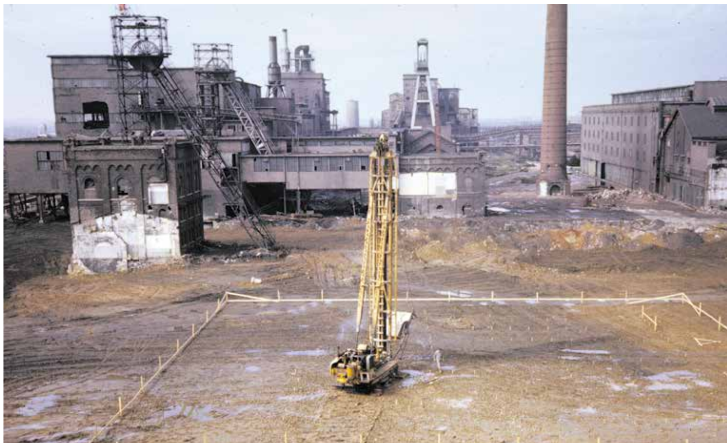
Start van de bouw van het Heerlense kantoor van het Centraal Bureau voor de Statistiek op de plek waar voorheen een deel van de Oranje-Nassauw mijn I lag