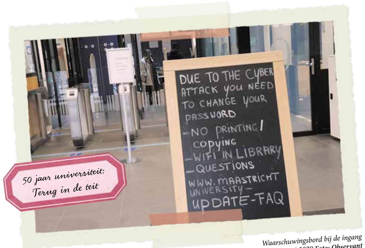
Waarschuwbord bij de ingang van de UB, begin januari 2020