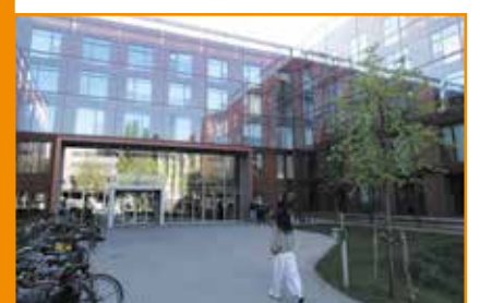
StuNest , voorheen het Nido, is een onlangs gerenoveerde residentie recht tegenover het MECC in Randwyck. Het is vooral populair bij internationale studenten.