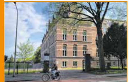
XIOR Student Housing heeft drie studentenhuusvestingscomplexen verspreid over Maastricht. Voor dit interview bezocht Observant hun Bonnefantencollege, een oud klooster dat is verbouwd tot 257 zelfstandige studentenstudio’s.