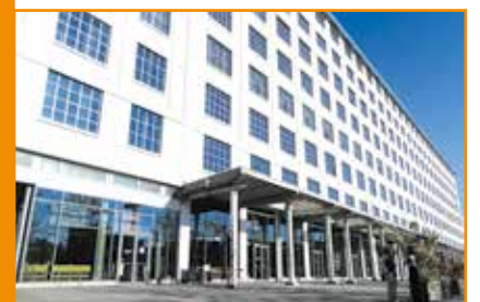
The Social Hub in het Sphinxkwartier in Maastricht maakt deel uit van een internationale keten van luxe hotels en studentenaccommodaties.