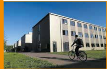
The Plaza verwijst naar het ‘containerwoningcomplex’ achter UM Sport: hier zijn de studio’s voorzien van een eigen keuken en badkamer en delen de bewoners alleen de wasfaciliteiten en één gemeenschappelijke ruimte.